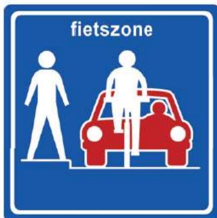
Afbeelding 1. Fietszone-bord

Het centrum van Maastricht, binnen de singels, is een druk en levendig gebied met veel bewoners, bezoekers, studenten, arbeidsplaatsen en evenementen. Dit zet de leefbaarheid steeds meer onder druk. De historische opbouw van het centrum, met smalle wegen en weinig plek, zorgt ervoor dat we de ruimte slim moeten indelen. Dit inspiratiedocument laat in de vorm van bouwstenen zien wat we kunnen doen om fietsen in het centrum prettiger te maken. Er spelen in het centrum veel meer belangen dan alleen prettig fietsen. Het inspiratiedocument is daarom nog geen integraal afgestemd inrichtingsplan voor de hele binnenstad. Dit volgt in de latere participatie/ ontwerpprocessen waarin de fietszone een van de belangen zal zijn.